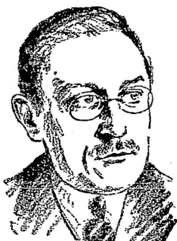
Вышинский, председатель суда на процессахъ «вредителей», назначенъ прокуроромъ на мѣсто Крыленко.

листовъ (весьма многочисленныхъ въ Царицынѣ), которые жаловались на вызывающее къ себѣ отношеніе со стороны мѣстныхъ рабочихъ. Орджоникидзе предложилъ имъ прежде всего отказаться отъ всѣхъ льготъ, выделяющихъ ихъ среди остальной администрации промпредприятий, а затѣмъ войти въ профсоюзныя организации и принимать непосредственное участіе, какъ въ работѣ, такъ и обще-заводской жизни наравнѣ съ спецами-гражданами СССР.