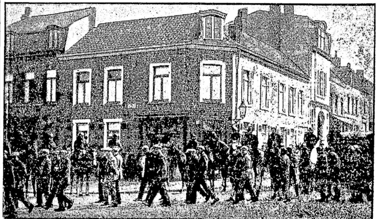
120 тыс. текстильщиц бастуют в северной Франции. Правительство отняло в районе забастовки большая полиция силы.