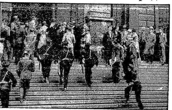
Столкновенія между разными студенческими группами въ вѣнскомъ университетѣ снова обострились и вызвали неоднократное вмѣшательство полиціи.