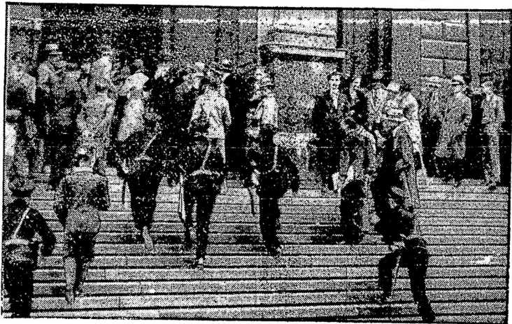
Столкновенія между разными студенческими группами въ вѣнскомъ университетѣ снова обострились и вызвали неоднократное вмѣшательство полиціи.