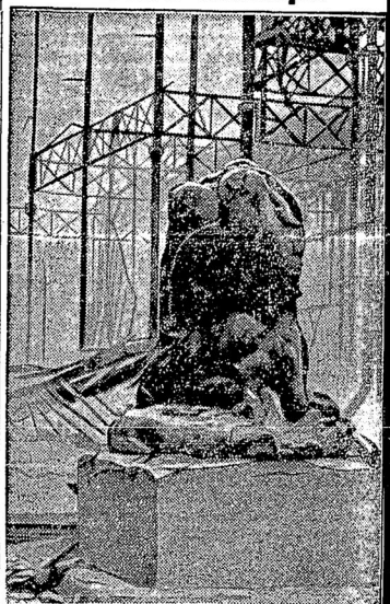
Развалины мюнхенскаго «Стекляннаго дворца»; на первомъ планѣ неузнаваемая попорченнаа огнемъ скульптура.