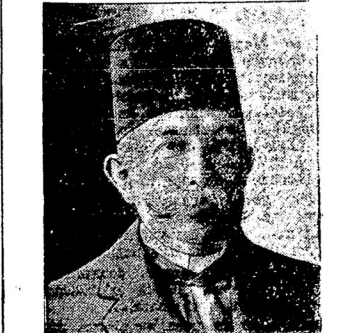
Умеръ въ своей виллѣ въ Босфорѣ бывшій египетскій хедивъ (турецкій мамъстинскій) Аббасъ Хильми, въ 1914 году изгнанный изъ Египта съ помощью англичанъ ѣльншимъ египетскимъ королемъ Фуадомъ.