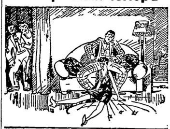
Трудно усидѣть на колѣнкахъ монета!