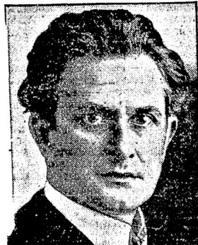
Умер знаменитый историк литературы, профессор Гейдельбергского университета Фридрих Гундольф, автор известных книг о Шенширфе, Гете, Стефане Георге и др. Гундольф заново перевел всего Шекспира на немецкий язык.