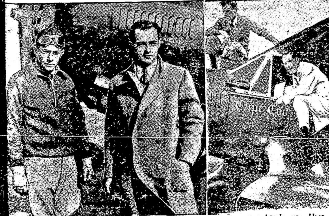
Направо: американскіе летчики Панборнъ и Херндорнъ, перелетѣвшіе изъ Нью-Йорка въ Англію черезъ Атлантическій океанъ. Летчики намѣрены облетѣть вокругъ свѣта и побить рекордъ, установленный ихъ же соотечественниками Постъ и Гатти. Направо — американскіе летчики Боардманъ и Поландо, вылетѣвшіе изъ Нью-Йорка въ Константинополь.