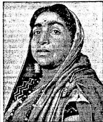
Индусская поэтесса Сарожини Найду, руководительница женского движения в Индии, ярая последовательница Ганди и спутница в Лондоне на англо-индийскую конференцию.