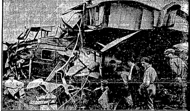
Голландскій пассажирскій аэропланъ, 3-моторный Фоккеръ, имѣвшій на борту 14 пассажировъ и 13 пассажировъ былъ принужденъ снизиться въ окрестностяхъ Роттердама, вследствие порчи лѣваго мотора. При посадкѣ аэропланъ заделъ крыломъ за сигнальную мачту и разбился. 6 пассажировъ отдѣлились легкими раненіями, а всѣ остальные — только испугомъ.