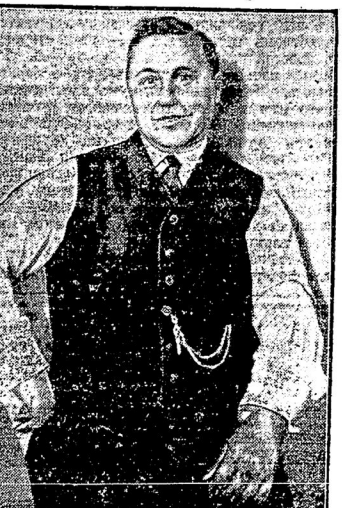
Разведясь со своимъ мужемъ, эта женщина рѣшила, что ей легче будетъ найти заработокъ въ видѣ мужчины. И дѣйствительно, въ изображенномъ на фотографіи видѣ, она въ теченіе семи лѣтъ стороннемъ служила на фабрикѣ и лишь случайно ее преступленіе было раскрыто.