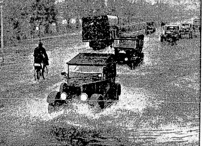
Автомобильная дорога у Лондона мѣстами находится подъ водою въ одинъ метръ вышины.