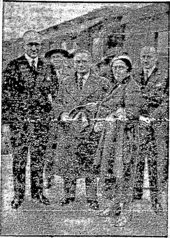
Наркоминдѣль Литвиновъ-Валлахъ съ своей супругой-англичанкой. Съ лѣвой стороны германскій посолъ въ Москвѣ Дирксенъ.

кой Рашаго, потребовавшей отъ Германіи серьезныхъ матеріальныхъ жертвъ и приведшей къ дипломатическимъ неудачамъ.