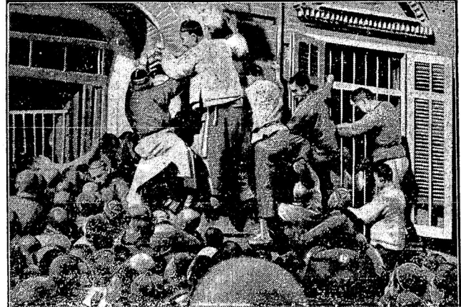
Въ Китаѣ то и дѣло голодные пытаются проникнуть въ гастрономическіе магазины, чтобы расхитить продовольственныя запасы.