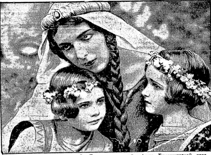
Но дно семисотлѣтія смерти Св. Елизаветы, ландграфини Тюрингенской готовится въ Германіи фильмъ.