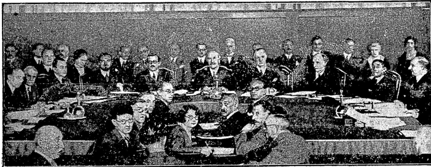
Слѣва: Бенешъ (Чехословакія) — третій Курціусъ (Германія) — Гранди (Италія) — Массильи (Франція) — Лерру (предсѣдатель, Испанія) — сэръ Эрикъ Друммондъ (Англія), генеральный секретарь Лиги Націй) — лордъ Сесиль (Англія) — послѣдній — Зальскій (Польша).