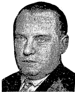
Алехин поббдил Боголюбова

На международном турнирб в Бледб Алехин выиграл партию у Боголюбова. Состояние турнира: Алехин 8 1/2, Шпильман 6, Кажань и Видмарь 5, Апталов, Боголюбов и Штолць 4 1/2, Костич 4 и 1 неконч., Тартаковер 4, Флорь 3 1/2 и 1 неконч., Марочн и Нимцович по 3 1/2, Колле 3 и Пирк 2 1/2.