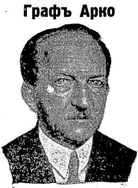
Извѣстный изобрѣтатель, графъ Арко, покинулъ правленіе общества Телефонны, въ которомъ онъ работалъ съ 1903 года, и намѣренъ впредь посвящать себя исключительно научнымъ изслѣдованіямъ.

латъ здѣсь, въ сутолокѣ берлинскихъ буденъ. Я-бы посоветовалъ каждому сдѣлать хоть одинъ разъ такую «сопшающую», умиротворяющую побѣдку... Населеніе «латгальское» — это русскіе крестіане, а въ самой Рѣжицѣ — евреи. Тѣ-же базары, тѣ-же сапожники, съ наклееннымъ на грязное окно, вырѣзаннымъ изъ бумаги сапогомъ, — размытыя дороги, ухабы, маленькіе мезонички. А на базарѣ — булочки, крашеные пряники, коньякъ — вотъ я кое-что привезъ съ собою (— и художникъ вынимаетъ изъ кармочка — символы прежнего быта) — я и горшокъ глиняный привезъ, облитый «полювомъ». На базарѣ — визжащій въ мѣшкѣ поросятокъ, — деревянные ложки —, ситенъ —, латпи... Отношеніе къ русскимъ латвійскихъ властей — и въ городѣ, и въ деревнѣ — самое лойальное, я-бы сказалъ: благожелательное. чти мы въ усадьбѣ. Шесть недѣль я не знаю, что такое электрической свѣтъ. На балконѣ мигала у насъ — керосиновая лампочка... Вотъ этюдъ балкона съ самоваромъ, булочкими и кузнецовскими чашками (снѣе съ золотомъ). Вотъ стогъ на полѣ. Вотъ облаки плывутъ съ востока... И когда перебираешь эти полотна, кажется, что ты съблизилъ къ этой границѣ и оттуда съ востока» надъ тобой проплыва эти-же о чѣмъ-то напоминающія тебѣ облака... А. Авдѣевъ.