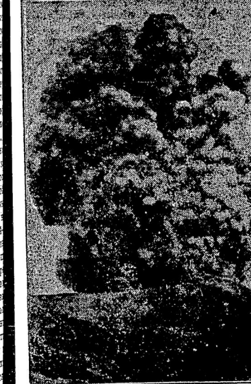
Вулканъ Кранатау извергаетъ потоки лавы; огненный столбъ виднѣется далеко въ океанѣ.