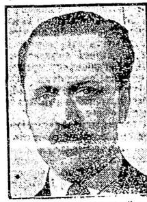
Погибшій при автомобильной катастрофѣ бывшій польскій Министръ - президентъ Графъ Александръ Скржинскій.