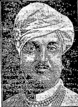
Мусульмане Нашмира свергли магараджу, индуса Гари Зинга, желая возвести на престолъ Нашмира мусульманина, Имантулу, брата Аманулы, бывшего короля Афганистана.

«Стоитъ ли, говорилъ онъ, оборачиваясь къ людямъ, толпившимся у другой стѣны зала, художнику отдавать свою душу, свою жизнь, свое умѣнье, всё сокровища своего искусства для стада барановъ (такъ и сказала для стада барановъ) для такой публики, которая, ничего въ искусствѣ не понимая, проходитъ мимо гонимого произведенія, чтобы увлечься пошлой дешевой бездарностью». Онъ настолько громко говорилъ, что многе изъ публики стали оборачиваться къ намъ и удивленно и немного испуганно смотрѣли на Левитана, котораго вѣроятно узнали. Я стала слегка дергать Исаака Ильича за рукавъ, чтобы его остановить, но онъ не обращая вниманія на меня продолжалъ свою рѣчь и я поняла, что нельзя и не нужно его удерживать, что въ немъ слишкомъ накопилась досада и отвращеніе къ тупой массѣ, для которой онъ творилъ.