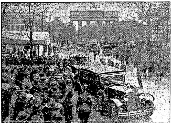
Французскіе министры. подѣзжаютъ къ гостиницѣ Адлонъ.

Далѣе Лаваль указалъ, что встрѣча въ Парижѣ и Лондонѣ подготовили тепераш-