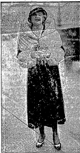
Знаменитая вѣнская пѣвица, гастролировала въ Берлинь.