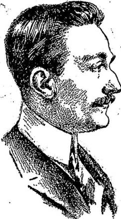
Prinz Napoleon hat einen Schlaganfall erlitten. Sein Befinden ist besorgniserregend.