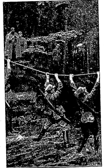
Die Wehrerziehung des deutschen Mannes. Besuch in der Reichsschule der Obersten SA-Führung in Dresden, wo die Auszubildung der SA-Führer zum Führer einer Wehrmannschaft erfolgt. — Hangeln — Überwinden eines Baches.