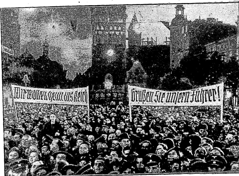
Große Kundgebung der Danziger Bevölkerung für die Heimkehr ins Reich. Ein Ausschnitt von der erhebenden nächtlichen Kundgebung auf dem Kohlenplatz vor dem Staatstheater in Danzig.