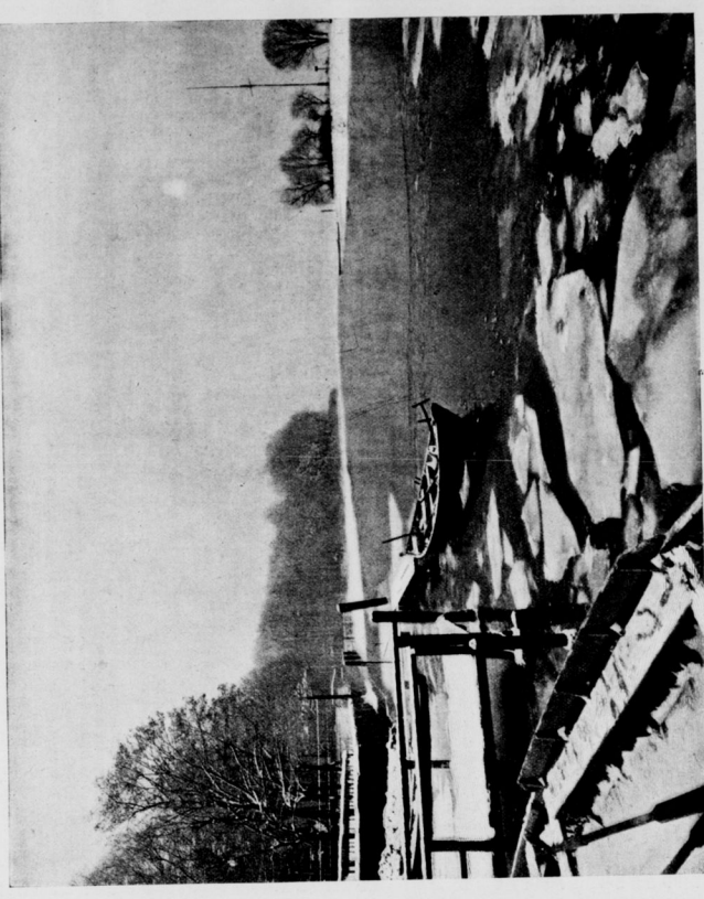
Der Müggelsee im Frost.

Eisport auf dem Müggelsee. Von Anna Pöschel. (Mit vier Eisenbahnwagen von Jander & Sabitz, Berlin.) Der Winter hat seinen nordpolarischen Charakter hat den fast ...verlorenen Eisport wieder zur Blüte gebracht. Als nach ...Reinholden Eisport kam, und die künftigen Eisport ...und die künftigen Eisport kam, und die künftigen Eisport ...und die künftigen Eisport kam, und die künftigen Eisport ...und die künftigen Eisport kam, und die künftigen Eisport