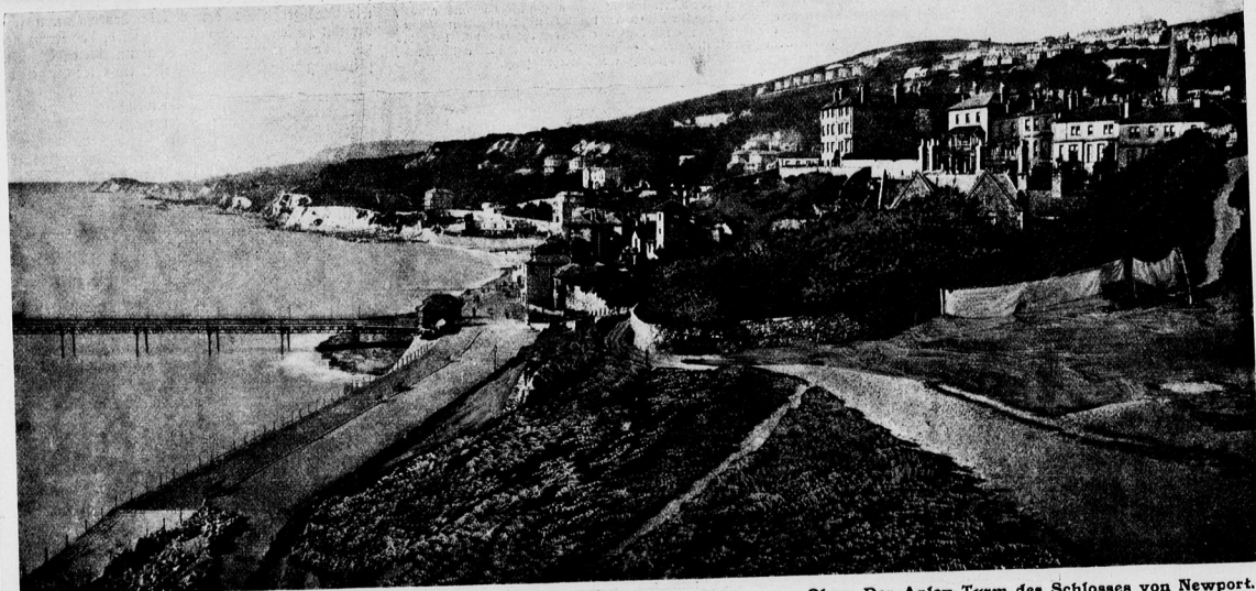
Oben: In der Freshwater-Bai.