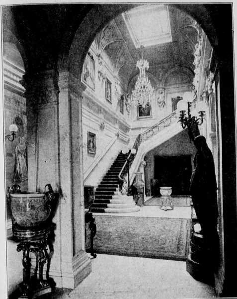
Das Vestibül mit dem Treppenhaus.

Wie Dollarfürsten wohnen. Interieurs aus dem Haus Forster beim John Jacob Astor.