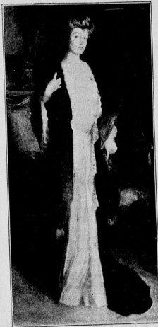
Frau John Jacob Astor, die bisherige Herrin der Räume. Gemalt vom Fürsten Trubetzkoy.

Wie Dollarfürsten wohnen. Interieurs aus dem Haus Forster beim John Jacob Astor.