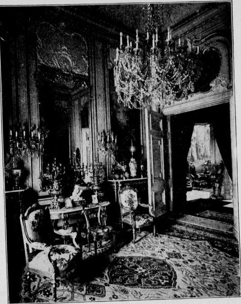
Ecke in einem Fremdenzimmer.