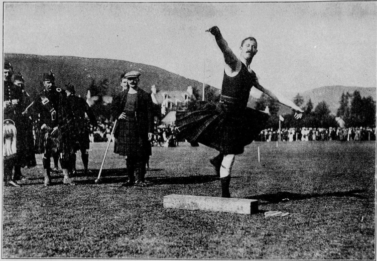
Hochländerspiele in Schottland: Ein Meister im Steinwerfen.

Man macht sie zu Fuß, zu Rad, per Bahn. — Ein winziges Reichen hineingetan. — Und es entsetzt daraus eine Kraft. — Die mehr als Talent und Genie oft errafft! M. R.—n.