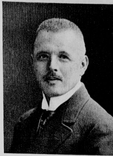
Otto Geßler, Reichswechminister.