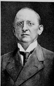
Dr. Koch, Giercke , Reichsminister des Inneren.