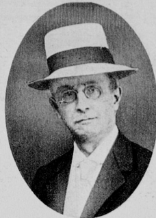
Schlie, Giercke , Reichsarbeitsminister.