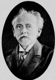
David, Reichsminister ohne Portefeuille.