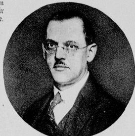
Hermann Müller, Reichsfinanz- und Reichsminister des Auswärtigen.