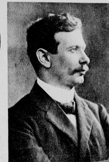
Wirth, Atlantic , Reichsfinanzminister.