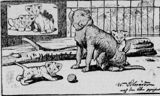
„Aus der Kinderstube des Zoo.“