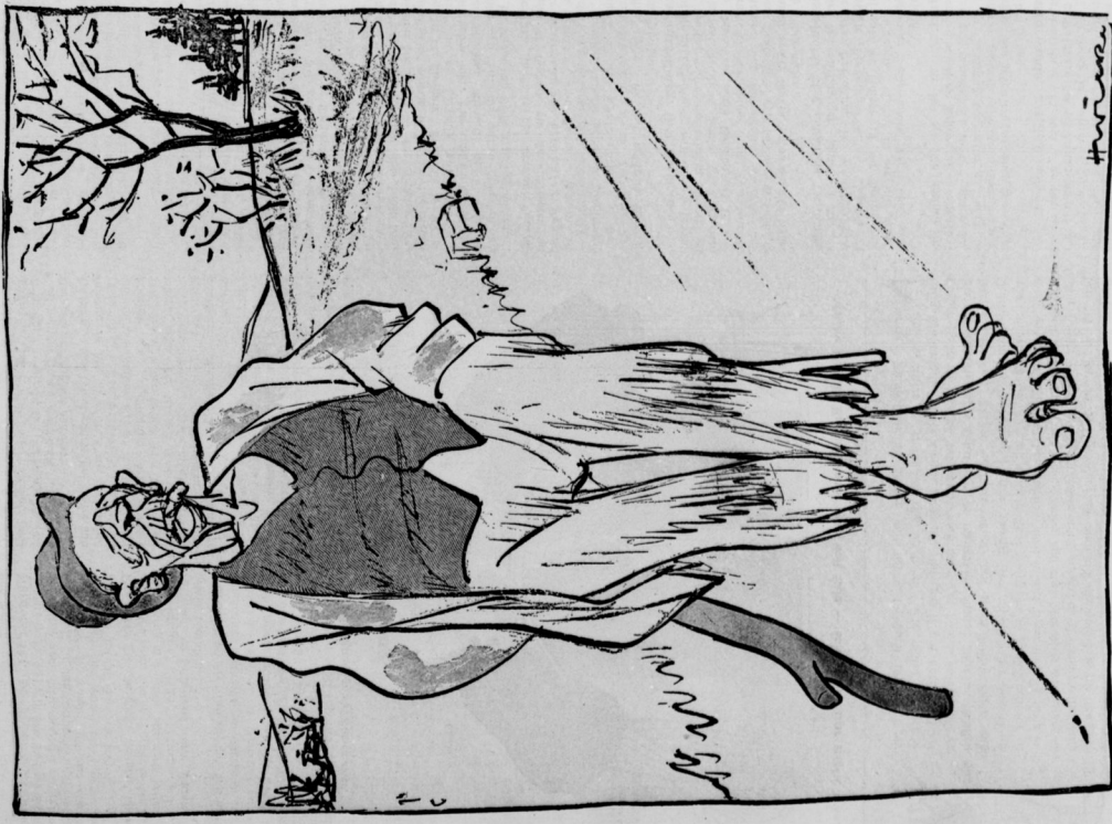
„Als wenn det wat Neues wäre! Ick hab' schon lange die steife Wäsche abjeschafft, trage Phantasteweste und eenen farbigen Anzuch, und keene Spur von lange Hosen!“