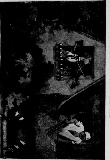
Es ist doch doll! Jetzt hab' ich das Blei schon zweimal tot geschossen, und es quetscht immer weiter!