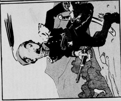
Ich jag' sie weiter immerzu. Doch wer bogst uns dann den Schand?