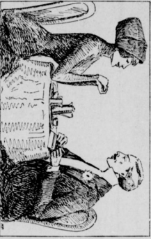
Sie Kleine stumme raff demselben vier Strepen hinunter... die Frauen heute Morgen verständig?... gelitten für einer Seeritterin.

Sie Kleine stumme raff demselben vier Strepen hinunter... Ein wichtiges Gespräch... Sie Kleine stumme raff demselben vier Strepen hinunter.