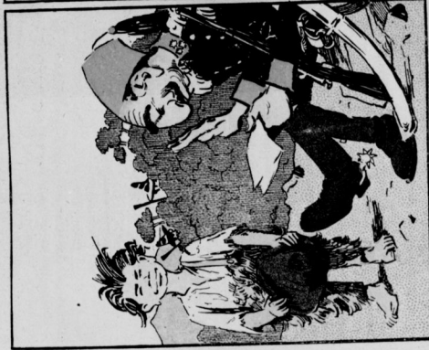
Ein Lösegeld? Fällt mir nicht ein! Kauft nur! Ich sehe hinterdrein.