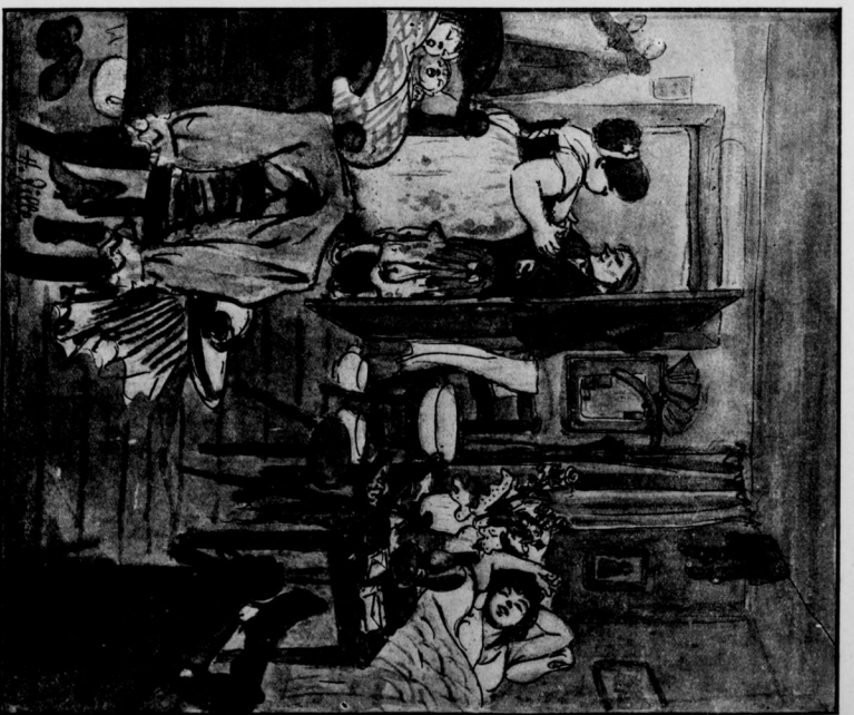
Na, Kussewizen, wai hat denn Ihre Alma allens zu'n Jehurtslach jekeicht?... Na, Kussewizen, wai hat denn Ihre Alma allens zu'n Jehurtslach jekeicht?

Die kleine Französin... die Frauen heute Morgen verständig?