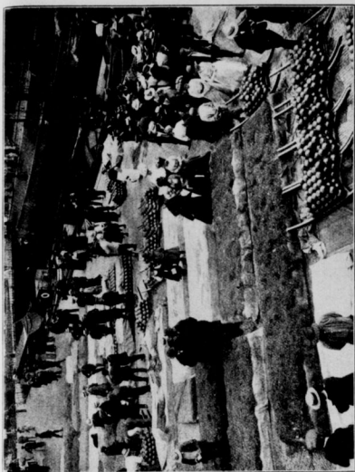
Der Markt auf dem Markt. Alkmaar in Holland, die Stadt der „Edamer Käse“.