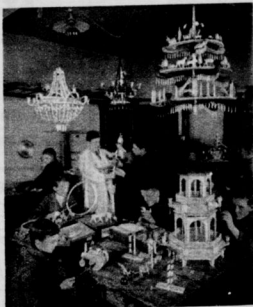
In der Werkstatt einer staatlichen Spielwarenfachschule. Photograph.

Ranichen im eigenen Saft gedämpft mit Zwiebeln. Das Ranichen wird in