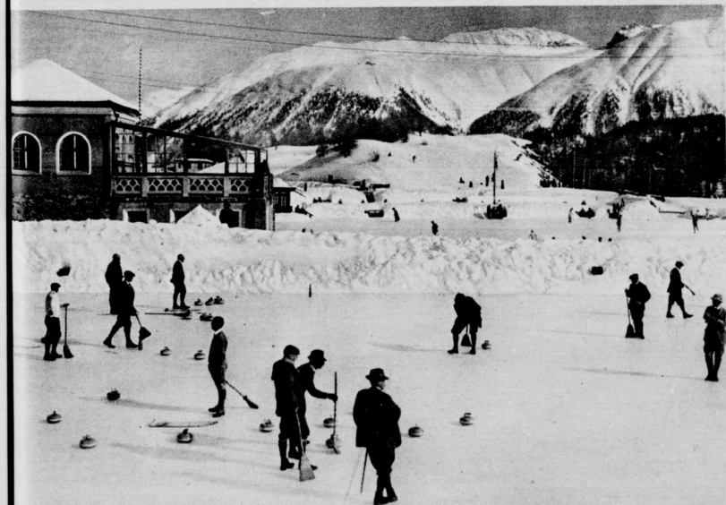
Auf den Eisspielplätzen von St. Moritz. Beim Curling.

erschreckenden Sägen, die ihres Mannes Glaubensbekenntnis bildeten. — Das Kindchen an ihrer Brust wimmerte leise. Arme, kleine Mir. Wenn du wüßtest, in welch ernste, rätselvolle Welt man dich geführt hat, und wie schwer die Aufgabe für die Eltern ist, dein Leben, das jedes höheren Zweckes entkleidet ist, dennoch reich und würdig zu gestalten. Mit dem Fest, das Bert geplant, hatte es indessen gute Weile. Klein-Mir gedieh nicht. Das blasse, kümmerliche Geschöpfchen stand an der Schwelle des Lebens wie ein Wais, der nicht weiß, ob er bleiben soll oder umfliehen. Ihn festzuhalten bot Doracis, selbst noch hübsch und hinfällig, ihre ganze Kraft auf, zermachte, zerlegte und zerarbeitete sich. Zum erstenmal vergaß sie, nach Berts Wünschen, nach Berts Bequemlichkeit zu fragen. Er mußte doch nicht nur ein- sehen, daß sie ihn nicht zu Gesellschaften begleiten konnte, wenn das Kind in Schmerzen wimmerte, über deren Ursache der Arzt immer noch nicht im klaren war, er mußte auch selbst zu Hause bleiben. Aber Bert, der Künstler, brauchte Anregung, und wenn er sie in der