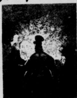
Weihnachten in Alt-Berlin. Nach einem alten Holzschnitt.