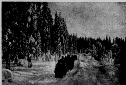
Winter im Riesengebirge: Ruffahrt von Hömerschlitten.