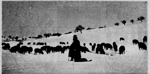
Schafherde im Schnee.

Dann trug man das blumenbeladene Särgelein hinweg, der Dekorateur räumte seine schwarzen Stoffbahnen und Kandelaber zusammen und rückte im Salon alles wieder an den gewohnten Platz. Und vor der Tür stand das Alltagsleben mit seinen tausend Anforderungen und kleinen Gewohnheiten, und Bert war, für seine Person, auch sehr bereit, es einzulassen. Aber neben dem leeren Bettchen, das entsetzen zu lassen, sie sich selbstschäftlich weigerte, verging Dorales im Kummer.