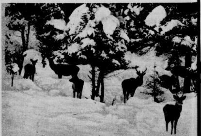
Winter in Oberbayern: Rotwild im Walde.