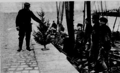
Der Weihnachtsbaum des Ostseefischers.