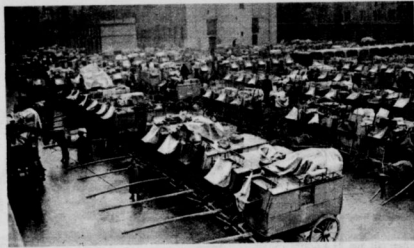
Weihnachtspakete auf dem Berliner Hauptpaket-Postamt.

olorosa-Miene. Und eines Tages trat, was lange heimlich in ihm gegärt hatte, schroff zutage. „Ich habe deine Schwermut lange respektiert, aber Dorantes, jetzt wünsche ich aber wirklich ein anderes Gesicht.“ (Fortsetzung folgt.)