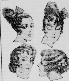
Der Abbau des Bubikopfes in Paris Man greift wieder zu alten Modetypen zurück

Die Blumenindustrie im französischen Bezirk, die in den letzten Wochen abwärts und Erhebungs gegen 1500 Arbeiterinnen beschäftigt, und in Selbst gegen 5000 Arbeiter Brot gibt, ist zurzeit von einer schweren Arbeitskrise bedroht. Die Gründe hierfür sind besonderer Art. Die Blumenindustrie ist ein der Mode besonders unterworfenen Produktionszweig, und gerade die Mode spielt hier in diesem Jahre einen bösen Streich. Der „Bubikopf“, der im Ausland noch viel häufiger anzutreffen ist, als bei uns, verbietet das Tragen großer Hüte. Die kleinen Phantasieformen verzichten aber zumeist auf Blumenkranz und Aufputz. Das ehemalige Hauptabgabebiet Amerika nimmt kaum noch etwas auf