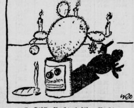
6. Stille Nacht, heilige Nacht

„Wenn ich der Weihnachtsmann wär, würde ich mich dem deutschen Volke als Reichstänzer schenken.“