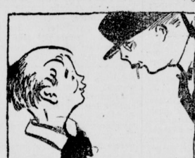
4. Der Nistkäuer

„Nach so drängeln, jellern hab' ich zwar Kinder gerädert und die auch ich erleben.“