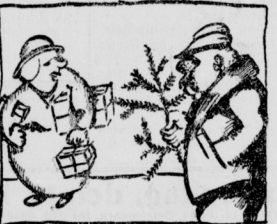
2. Die Tanne

„Enel, was bist du denn von Beruf?“ „Weihnachtsmann, mein Junge.“ „Was fe, im ganzen Jahr nur einen Tag arbeiten.“