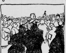
1. Auf dem Weihnachtsmarkt

„Nach so drängeln, jellern hab' ich zwar Kinder gerädert und die auch ich erleben.“