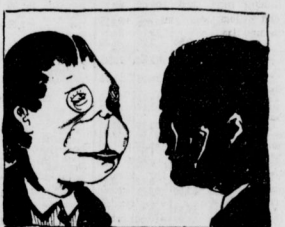
„Ach, was für een Kostüm soll ich zum Wasenball anziehen?“ „Koh die vorher nich kosten und jeh als Kise.“