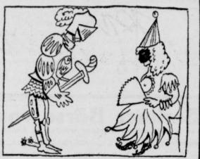
„Schöne Waise, würden Sie gestatten, daß ich mit erstaube, mit Ihnen eine feste Sohle auf das Parkett des Hauses niederzuliegen.“