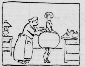
„Mutto, was sehn Anoten, der hält nachher bei der Bemastierung so auf.“