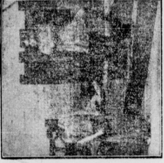
Szenenbild aus „Frau im Stein“

Copyright 1925 by James Simon, Berlin - Grunewald Samme-mappen für „Jede Woche Musik“ kosten bei den Rudolf Mosse-Filialen in Berlin 0,75 M. (nach anseherheit 1 M. franko)