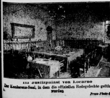
Ein Justizpalast von Locarno. Die Konferenz-Saal, in dem die offiziellen Redegesichte geführt werden