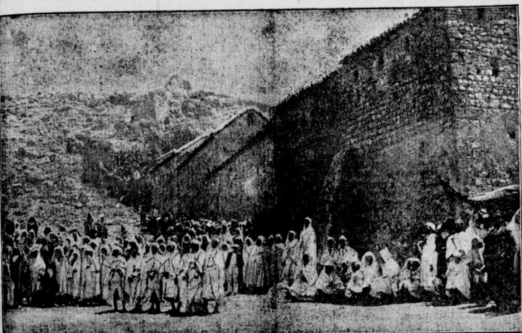
Magistrat und Einwohner einer bisher mit Abd-el-Krim verbündeten Stadt erwarten untertänigst den spanischen Sieger am Stadtor