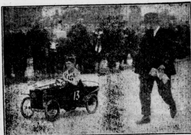
Ein Auto-Rennen für Kinder. Ein Pariser Miniatur-Automobil, das von einem richtigen Benzinmotor getrieben wird