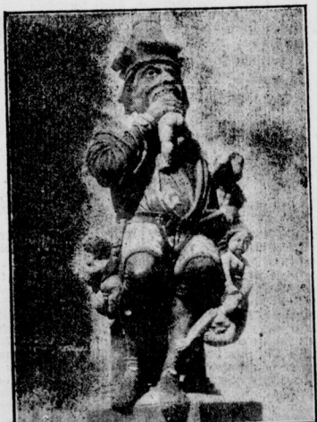
Ein phantastischer Märchenbrunnen. Der „Kindfresser“ von Bern in der Schweiz