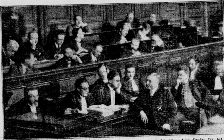
Der mit anarchistischen Kreisen sympathisierende Sohn des französischen Antisemitenhüpfings Léon Daudet (X), hat unter dunklen Umständen in einem Auto Selbstmord begangen. Der Chauffeur klagt gegen den Vater, der hartnäckig von einem Mord spricht