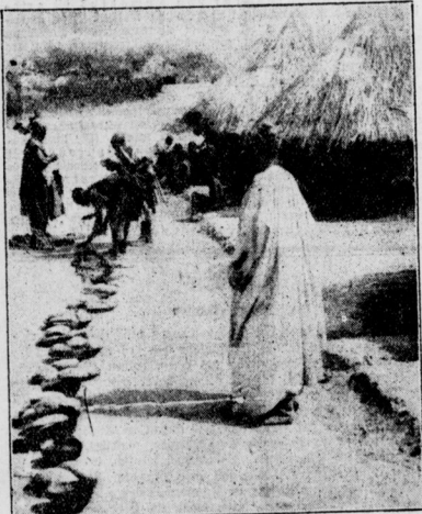
Im kameruner „Frühstückstisch“ In Afrika werden die grossen Negerbrote zu ebener Erde serviert