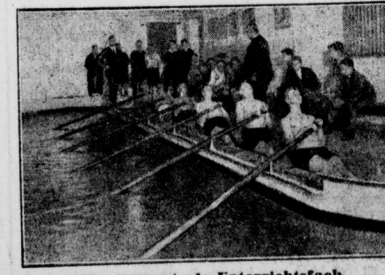
Wassersport als Unterrichtsfach Durch Ministerialerlass ist Rudern in das Schulprogramm aufgenommen worden