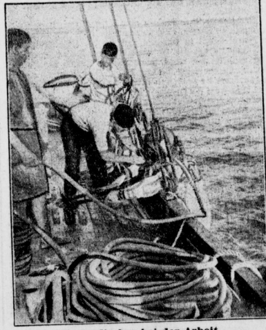
Perlenfischer bei der Arbeit Die Sturmkatastrophe im Persischen Golf hat tausenden von Perlenfischern das Leben gekostet