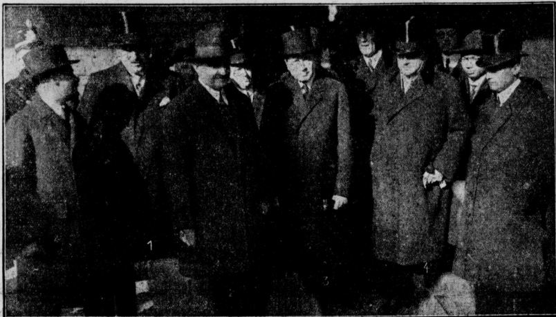
Der österreichische Bundeskanzler traf heute in Berlin ein 1 Staatssekretär Schubert, 2 Kanzler Ramek, 3 der österreichische Gesandte Frank und 4 Minister Stresemann am Anhalter Bahnhof