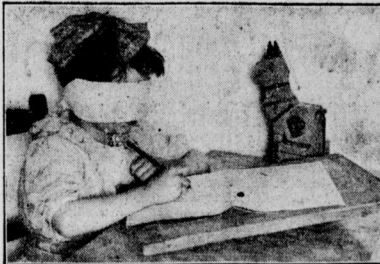
Blindekuh-Zeichnen In englischen Schulen müssen die Kinder nach kurzer Betrachtung des Gegenstandes ihn bei verbundenen Augen zeichnen