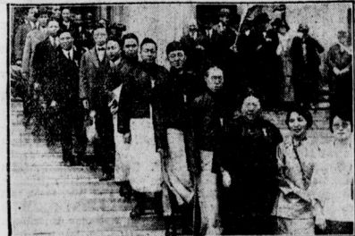
Gelber Besuch bei Coolidge Eine Abordnung chinesischer Methodisten besucht alljährlich den amerikanischen Präsidenten in Washington