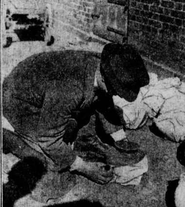
Urnenfunde in der Mark Brandenburg Die Urnen werden bandagiert