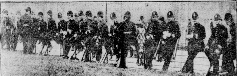
Im Kampf gegen den Generalstreik Londoner Polizisten bewachen das Lebensmittellager im Hyde-Park