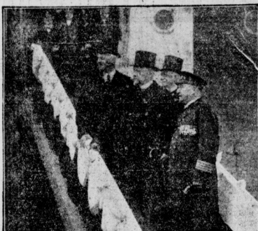
Ausgerechnet (uno): Der Inflationskanzler hielt bei einer Dampfbesichtigung mit dem Reichspräsidenten in Hamburg eine Rede, in der er die „staatszerhaltenden Kräfte“ in Empfehlung brachte