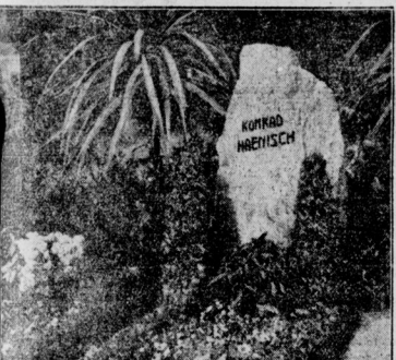
Konrad Haenisch zum Gedächtnis Auf dem Begräbnis in Wiesbaden wurde ein Gedenkstein für den republikanischen Vorkämpfer und Führer des Republikanischen Reichsbundes eingeweiht