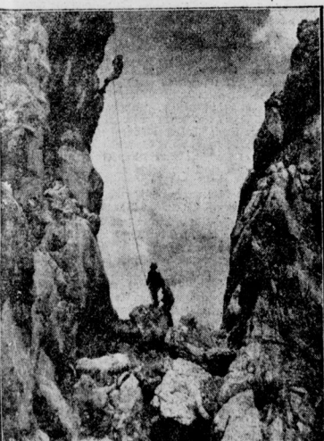
Bergsport auf zweierlei Art Eine schwierige Kletterpartie im Bayerischen Hochgebirge