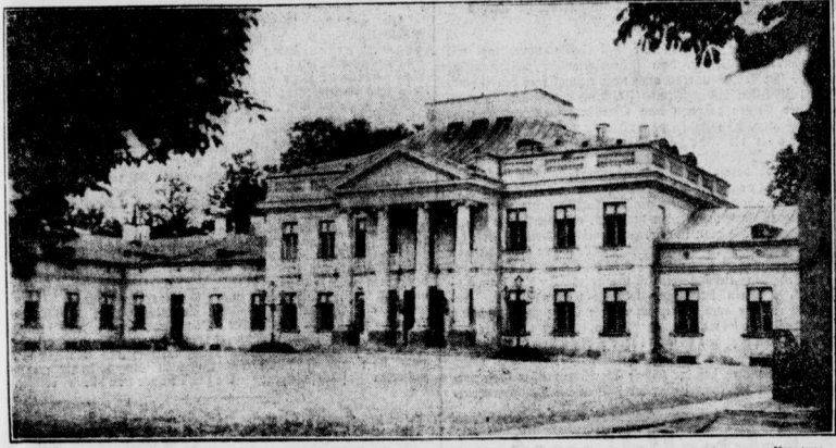
Schloss Belvedere in Warschau. In das Präsidentenpalais, in das sich die polnische Regierung flüchtete, wurde nach schweren Kämpfen von Pilsudski eingenommen.