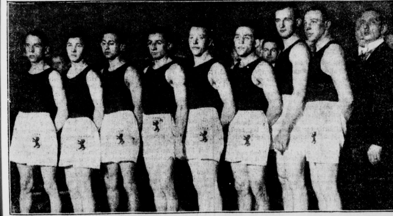
Der Boxkampf Irland-Berlin Die Berliner Amateure siegten im Sportpalast mit 10:6 Punkten