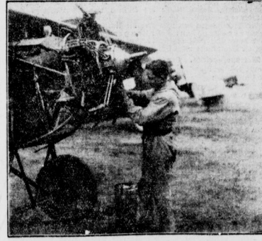
Vor dem Pfingstaufstieg mit dem Flugzeug Der Motor wird geprüft