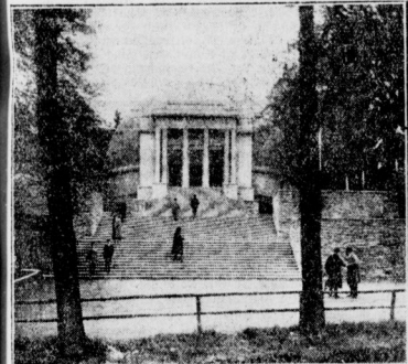
Ein Planetarium für Barmen Der neue Kuppelbau

Die polnische Delegation für die deutsch-polnischen Beziehungen trifft morgen in Berlin ein. Das Aufsichtswesen, das fern war der Verhandlung durch den Staat über befristet wurde, soll nach den Vereinigten Staaten verfrachtet werden. Bei Verhandlungen mit Pilsudski- und Pilsudski-Verhandlungen in Ostpreußen (Kammin) Karlhan Dimes aus einer Höhe von 1000 Metern ab und den 1. Juni 1926.