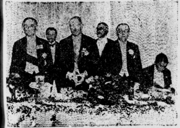
New-York-London in zwei Stunden Ein durch Radio übermitteltes Bild