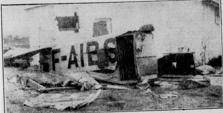
Der Flugzeugunfall auf dem Tempelhofer Feld. Das abgestürzte französische Flugzeug, dessen Insassen nur leicht verletzt wurden.