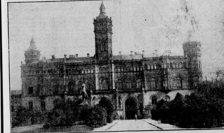
Die Technische Hochschule Hannover Der Schauplatz der empfindlichen Studentenkämpfe