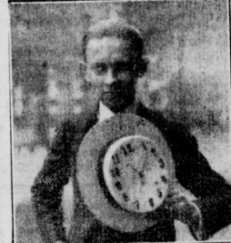
Jeder seine eigene Turmuhr Die letzte Mode, ein Schutz gegen „Taschen“diebe