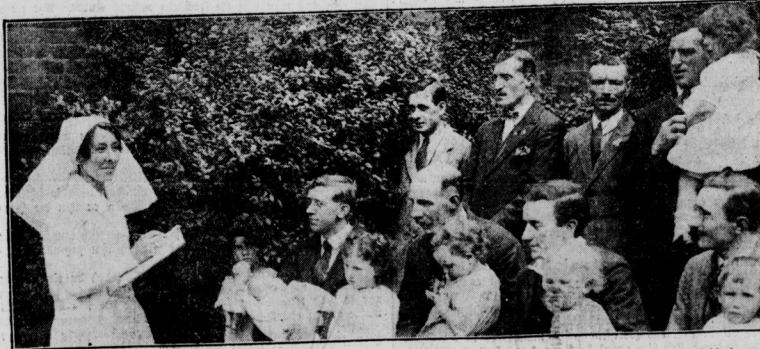
Unterricht in der Säuglingspflege für Väter Die Vermännlichung der Frau zwingt amerikanische Väter, ihre Kinder selbst zu wärmen