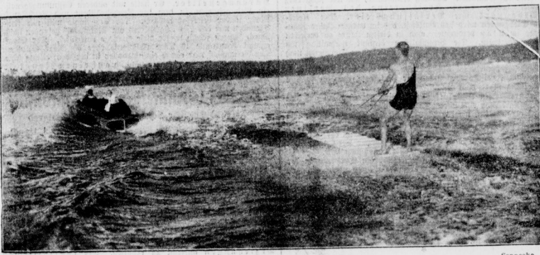
Wellenreiter auf dem Wannsee Von einem Motorboot lässt sich der Reiter, auf einem Brett stehend, über das Wasser ziehen

Der englische Altkanzler Wilson hat heute in Melbourne, dem Ziel seines London - Australien - Hin- und Rückfluges, die britische Reichspostpräsidentin 288c, der gehen die Titel Kommandeur bei Eberhard befestigt hatte, die ebenfalls für das Reichspostamt vorgeschlagen worden ist, reift morgen in Köln ein, um an dem Arbeiter-Tage und Gewerkschaftstag teilzunehmen. Die Witwe des verstorbenen Wilson ist an Bord des „Arcturion“ nach England abgefahren, um wo sie sich nach Genf begibt, um der Leiche des verstorbenen Wilsons beizugehen. In einem Leitartikel fordert die Pariser kommunistische „Humanité“ die Auflösung der Kammer. Der italienische Reichspostminister, Generali Robilic, wurde zum Ehrenbürger der Stadt Rom ernannt. Nach einer Mitteilung aus Angora soll die türkische Regierung die Schließung der ausländischen Handelskontore in Konstantinopel angedacht haben. (Antifrag.) Der stellvertretende Reichsminister der Reichskommunikation, Comptenon, Ruffschew, ist zum Vorgesetzten des Obersten Postwirtschaftsrates ernannt worden.