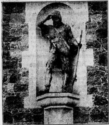
Ein Denkmal für Robinson Crusoe Der klassische Abenteurer Alexander Selkirk, den Daniel Defoe in seinem Robinson verewigt hat