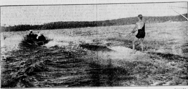
Wellenreiter auf dem Wannensee