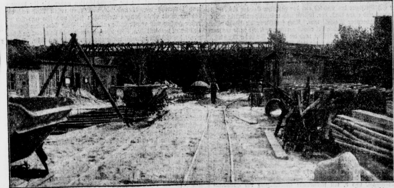
Der Durchstich unter dem Südring vollzogen

Durch die Untertunnelung des Güterbahnhofs Tempelhof wird eine neue Ausfallstrasse nach den südlichen Vororten geschaffen