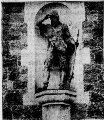
Ein Denkmal für Robinson Crusoe

Der klassische Abenteurer Alexander Selkirk, den Daniel Defoe in seinem Robinson verewigt hat