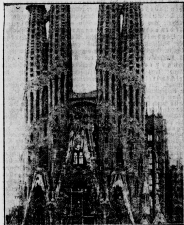
Eine eigenartige Kathedrale in Barcelona Die „Kirche der Heiligen Familie“ geht nach jahrelanger Arbeit ihrer Vollendung entgegen ABC