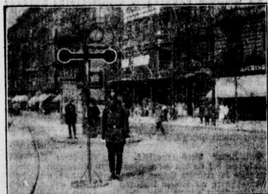
Der neue Verkehrsregler