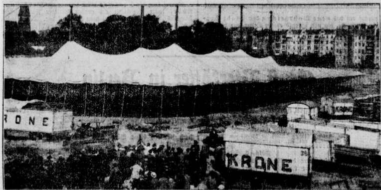
Zirkus Krone wieder in Berlin Der Aufbau der Zeltstadt in Wilmersdorf

Zur Teilnahme an einer Studientreise durch Schlesiens trafen in Kommunalpolitiker aus Brinnau, Görlitz, Annaberg und Weichenau in Ostpreußen ein. Die russische Volksgesellschaft in Berlin sowie die russischen Konsulate in Berlin, Köln und Osnabrück sind aufgehoben worden. (Kontinuität.) Die russische Regierung befehlet, den unter dem Regime Wangschi tätig gemeinten Ratsmitgliedern so lange die Ausreise aus Deutschland zu untersagen, bis eine genaue Prüfung der Kontinuität dieser Ratsmitglieder erfolgt ist. Nach dem Konbörner „Times“ besteht Grund zu der Annahme, daß ein Vertrag zwischen der Inhaberin, des persischen und der russischen Regierung vor dem nächsten Herbst abgeschlossen werden wird. Das persische Kabinett ist gestern zurückgetreten. Nach einer Botschaft aus Berlin ist angehebt der Meinung, daß die Gruppen Russlands an der Sitzung neue Niederlagen erlitten haben, um allen eventuellen Vorwürfen, ein französisches Kabinett an den Kampf abzugeben. Die italienische Regierung hat dem Internationalen Institut für Vereinheitlichung des Währungsrechts einen Teil der Währungsdiagnostik als Geschenk angeboten und verspricht, daß jährlich dem Institut ein Million ihre überreichen werden.