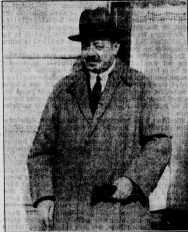
Seine letzten Tage in Genf?