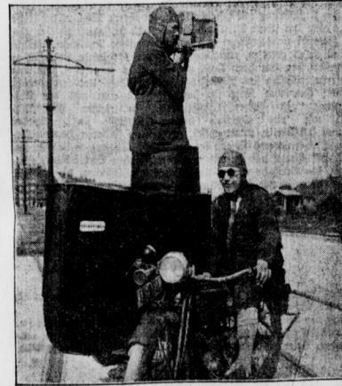
Schnelligkeit ist alles Dunkelkammer und erhöhter Stand an dem Motorrad des Zeitungsphotographen