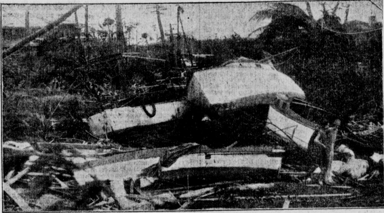
Die Zerstörungen in Florida Auf Land gewortene Seefahrzeuge