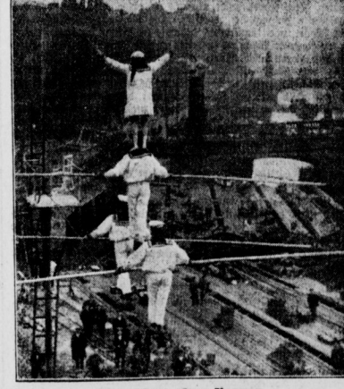
Menschen ohne Nerven Die Artistengruppe Wallenda stellt zu Vieren eine Pyramide auf dem Drahtseil