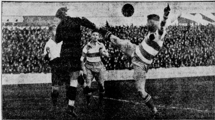
Der Hertha-Sieg gegen Preussen Akrobatenleistung eines Hertha-Mittelstürmers bei den Verbandsspielen