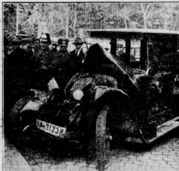
Schweres Autounglück in Moabit Gestern früh stießen Ecke Alt-Moabit und Invalidenstrasse ein Droschkenauto und ein Lastkraftwagen zusammen