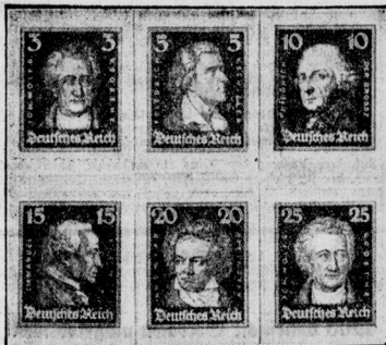
Die neuen deutschen Briefmarken Republikaner leben keinen Stingl-Fridericus Wolter