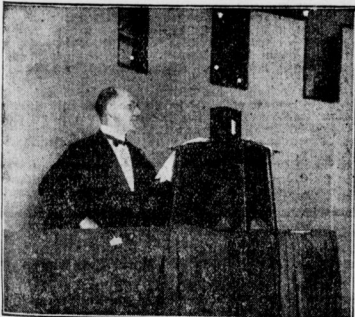
Das Herbstfest unter Schwarz-Rot-Gold Kultusminister Becker hält die Festrede Transseuropa

In Barcelona sind 5 Kommunisten unter der Beschuldigung ein Verbrechen auf den spanischen Boden begangen worden.