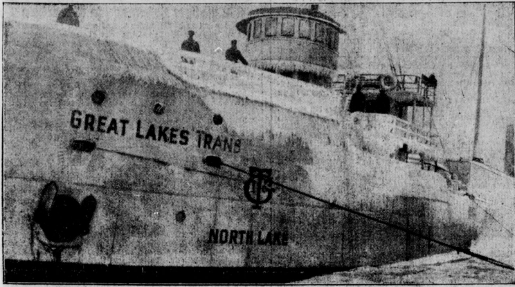
Eissturm in Nordamerika

Ein Eisbrecher, von dem 125 auf den grossen Seen eingefrorene Dampfer Hilfe erhoffen