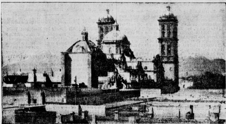
Revolution in Mexiko Puebla, einer der umstrittenen Orte