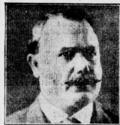
Obregon schlug den Aufstand nieder