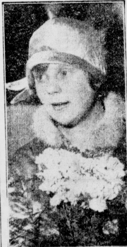
Sonja Henie, der Schlittschuhstern, gastiert in Berlin