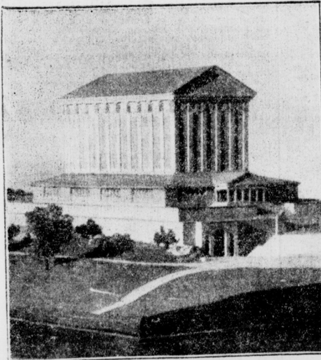
Ein Sinfoniehaus für Baden-Baden Entwurf Prof. Ernst Haiger