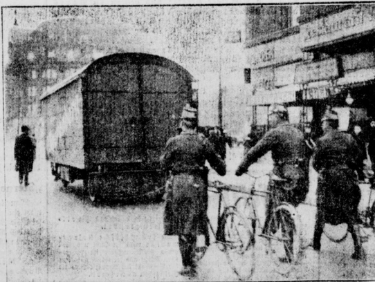
Umzug mit Polizei Die Schupo schützt Streikbrecher