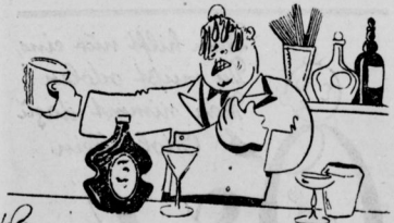
Der Mixer hat ein Ei dem Cocktail beifügen wollen

Der praktische Unterricht ist ein Schulspiel, das den Vätern mit unbedingter Ehrlichkeit erfüllt. Da stehen sie, die hoffnungsvollen Anfänger und vor ihnen baut sich die Stellung auf, die sie erobern sollen: das Buffet mit unzähligen Flaschen, in deren Glas sich alle Regenbogenfarben spiegeln, mit Gläsern, Bechern, Pfalen und Kählern. Da gibt es Schaumfänger und Glaswürden, Eisgib und Deller, Käse-